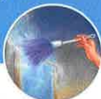
Ácaros del polvo