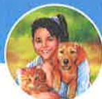
Caspa de animales