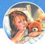
Resfriados y virus