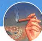
Humo del tabaco