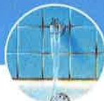
Mohos de interior